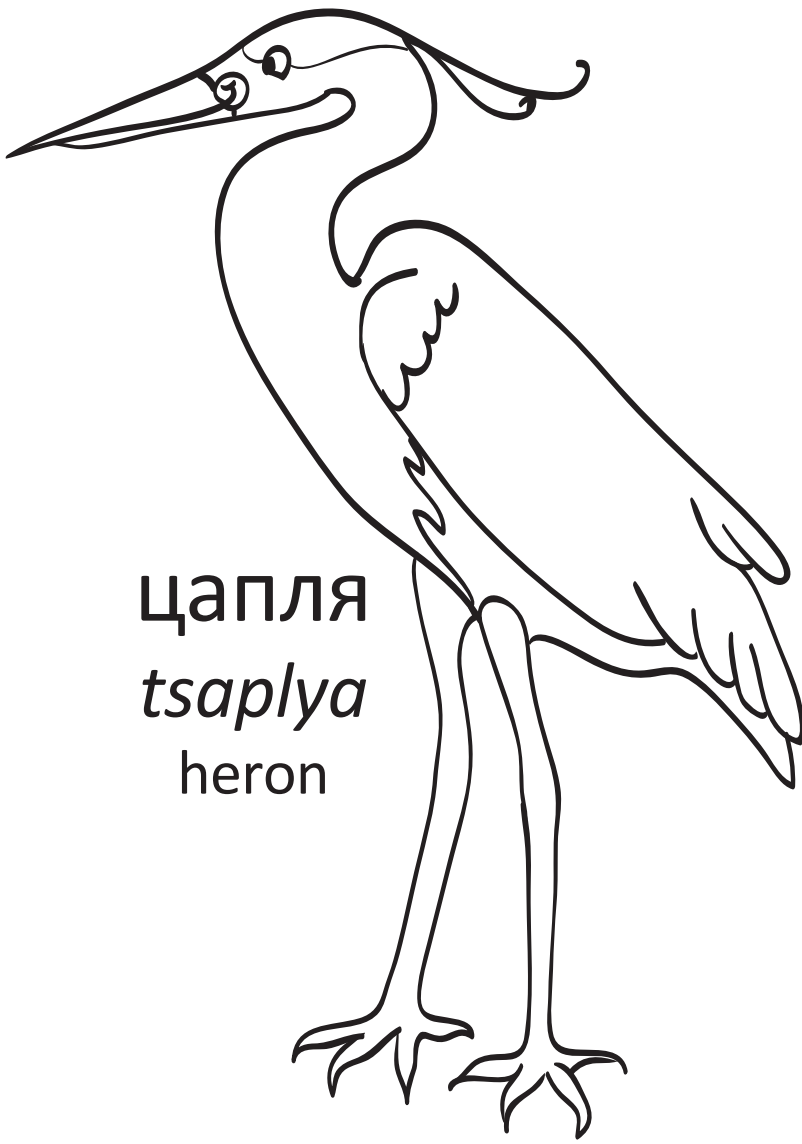
цапля tsaplya heron