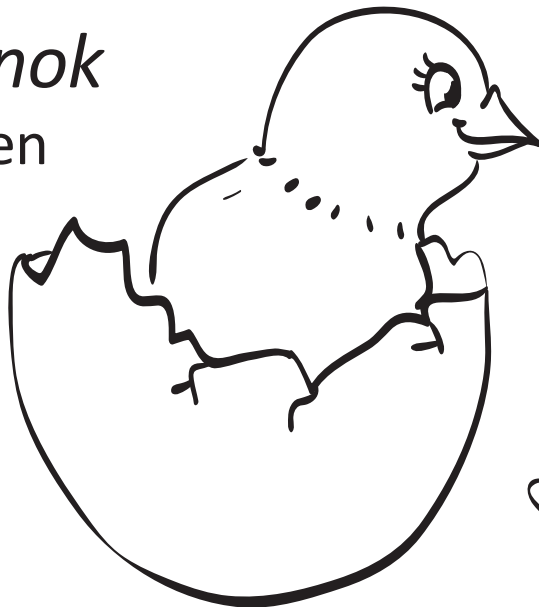
цыпленок tsyplenok chicken